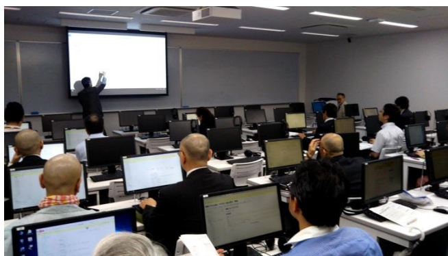
(第 1・2 回研修会の様子)

私はこの研修の後、担当している「コンピュータ基礎」でのビジネスメール作成課題および「新入生セミナー」でのプレゼン発表において、ルーブリックを作成し、事前にどういった評価軸になるかを学生に示したところ、どちらの講義でも 8~9 割の学生がルーブリックを参考にして課題などに取り組んだとのことでした（学生による授業アンケートにおいて「どの程度ルーブリックを参考にしたか」アンケートを行った結果より）。まだ 1 回しか試していないため、その効果は定かではありませんが、少なくとも自分たちがどのような評価軸で採点されるかを確認できることは、学生にとって一定のメリットはあるようです。また、研修会でも紹介されていたように、一度ルーブリックを作成してしまうと、評価作業はとても効率的に行う事ができました。今後、これらを改良しながらしばらく試行錯誤をしていきたいと思える手応えはあったように思います。